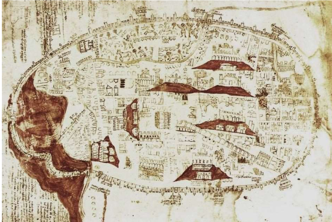
Vista de Roma, Paolino de Venecia, circa. 1320.

Historia de las ciudades hispanas y europeas, y su proyección a América (1250-1600)